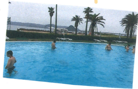
たーい プールで 泳ぎました！！