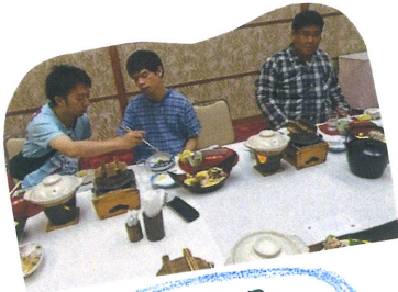
おいしい料理を 満喫