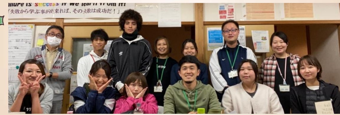
more is success if we learn from it 「失敗から学ぶ事が出来れば、その失敗は成功だ！」