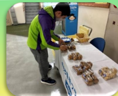
早良区役所でのバザー

お菓子工房ももちはいろいろな場所でバザー販売を行っています。現在、学校・公民館・区役所での販売やイベント出店も行っています。利用者さんの販売・接客技術の向上、地域の皆様との交流を図っています。